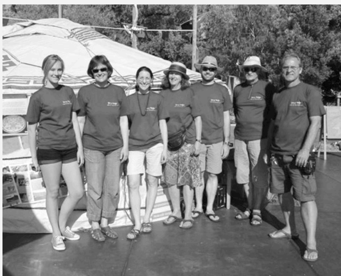
Viele aktive Helfer waren an den beiden Wochenenden mit dabei (das ist nur ein kleiner Teil...). Vielen lieben Dank!

Herzlichen Dank an alle Helfer für Eure Anwesenheit, Hilfe und Ideen! Danke auch an unsere Gartenschau-Besucher am Stand und Ihre große Mitmach-Lust!