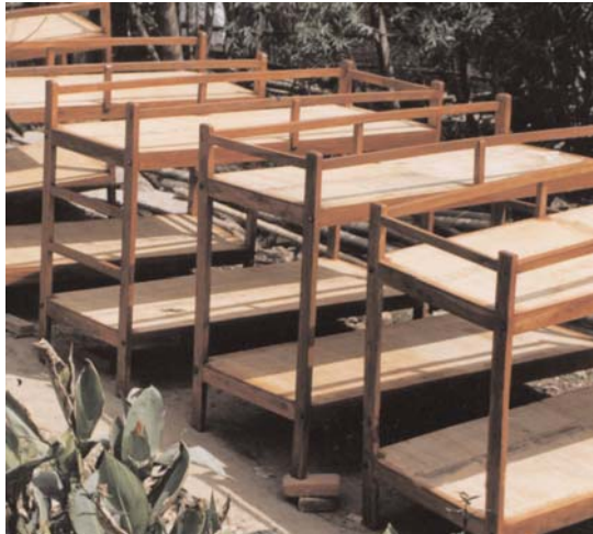
Stockbetten für die Uttargaya-Schule

Dass unser Verein staatlichen Schulen hilft, spricht sich in Nepal schnell herum. Seit 1997 haben wir über 30 Schulen mit Teilbeträgen für Schulmöbel, Tafeln, Lehrmittel, Bücherei, Latrinen und Wasserleitungen geholfen. Dieses Jahr wurde eine private Wohnschule, die Uttargaya-Schule in Betrawati, mit 10