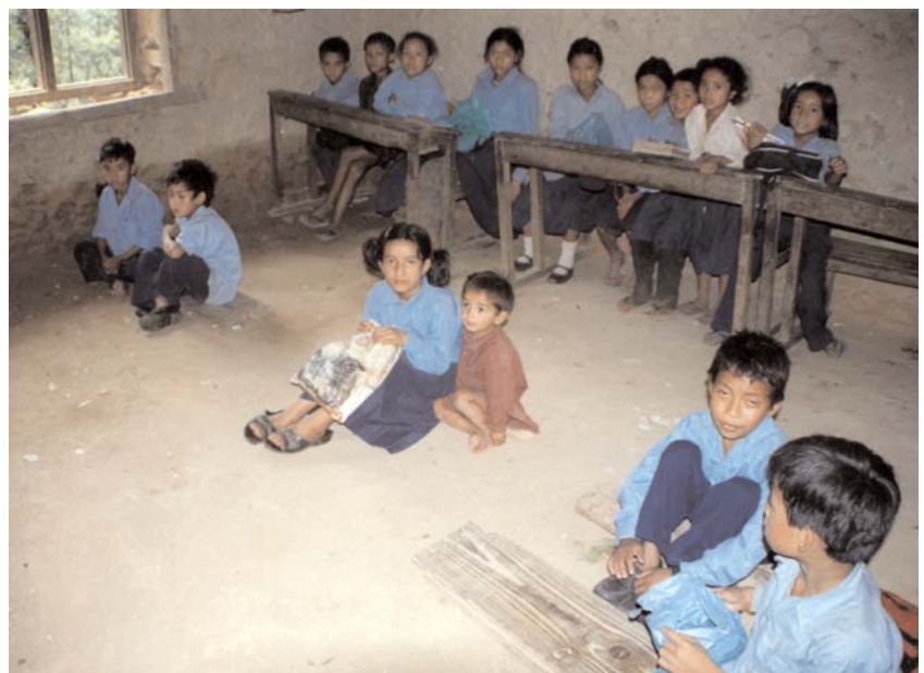
... die bisherigen Unterrichtsbedingungen in der Seti-Devi-Schule

Nachdem es an der Bhadrakali Schule in Churithumka nur langsam voran ging, erreichte uns zwischenzeitlich die Bitte um Hilfe von einer anderen Grundschule. Die Seti-Devi-Schule in Bhageni liegt in der Nähe von Nagarkot, zwei Fußstunden von Naldum entfernt. Die Schule verfügte zwar über ein stabiles Blechdach, aber von den Wänden rieselte der Lehmputz; große Löcher klafften darin. Türen und Fenster gab es keine. Der Fußboden sowie die Möblierung waren "landesgemäß". Die Kinder nehmen sich von zuhause ein kleines Stück Holz mit, legen es auf zwei Steine, fertig ist ihre Schulbank. Schultische gibt es keine, geschrieben wird auf den Knien. Die Möblierung im Lehrerzimmer bestand neben einem zerbrochenen Stuhl noch aus einem krummen