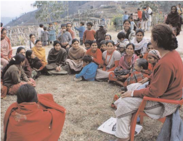
Interessierte Zuhörerinnen beim Gesundheitsvorsorgeprogramm