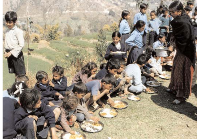
Gemeinsames Picknick mit den Kindern in Naldum

Liebe Pateneltern, Mitglieder und Spender, trotz vieler negativer Berichte in allen Medien über Elbe-Flut, Kosovo-, Afghanistan- und Irak-Krieg und trotz Rezession haben Sie Ihre Patenkinder von "Hilfe für Betrawati" (HTC) die ganze Zeit unterstützt. Sie tragen durch Ihr Patenschaftsgeld, Ihren Beitrag und durch zusätzliche Spenden dazu bei, dass wir den "Betrawati-Kindern" eine Ausbildung geben und zahlreiche weitere Hilfsaktionen starten konnten.