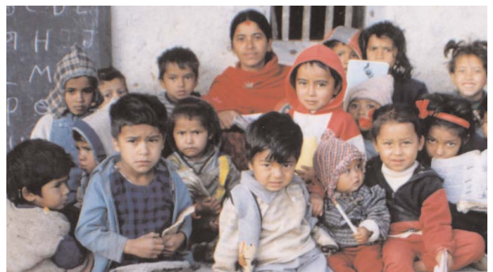
...die Schüler von morgen...in der Vorschule

Bitte geben Sie auf dem Überweisungsträger unter "Verwendungszweck" Ihre vollständige Adresse zur Ausstellung der Spendenquittung an.