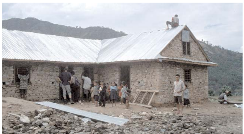
Die Bhadrakali-Schule - kurz vor der Fertigstellung des Gebäudes