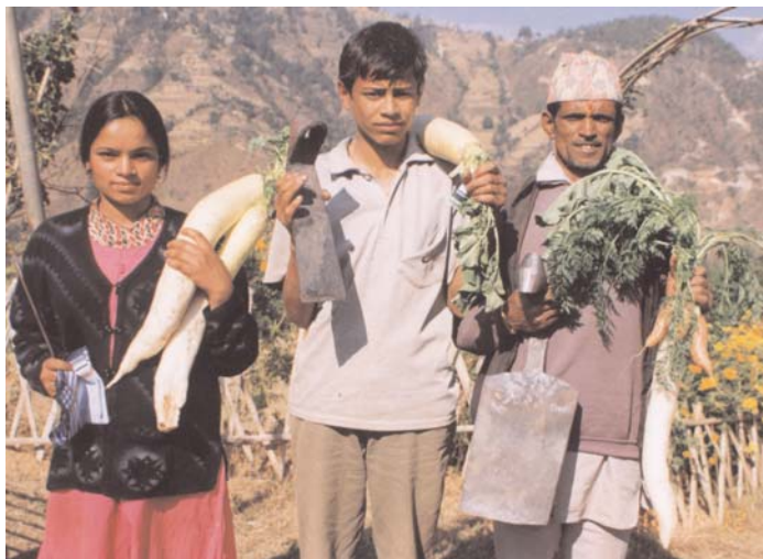
Die Gewinner der landwirtschaftlichen Preisverleihung