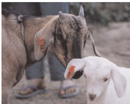
Zuchtkapital und Züchterfolg!